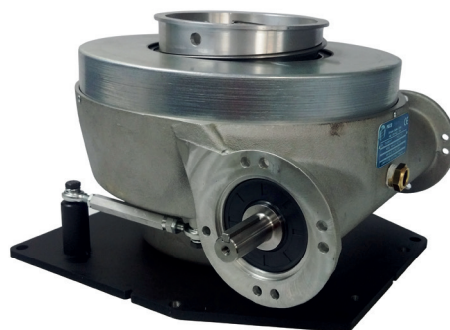
Spiralift® HD6 // 视图 01