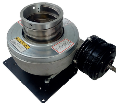
Spiralift HD6 // 视图 02